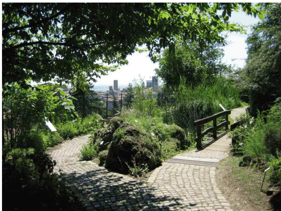
L'Orto botanico di Bergamo

Di Redazione | 25 febbraio 2015 | - + Dimensione testo | Stampa questo articolo | Send by Email