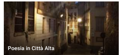
Poesia in Città Alta